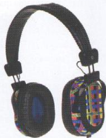
IZQUIERDA: AURICULARES DE SKULL CANDY; DERECHA: EL ÁLBUM SYMMETRY, DE MICHAELANGELO L'ACQUA PARA W HOTELS; ABAJO: EL ÁREA WET DEL W SOUTH BEACH.

ML: El concepto es la universalidad y lo contemporáneo. Busco entre muchas raíces y selecciono esas canciones que resuenen en el oído, después de haberlas escuchado por su equilibrio simétrico entre ritmo, melodía y estructura.